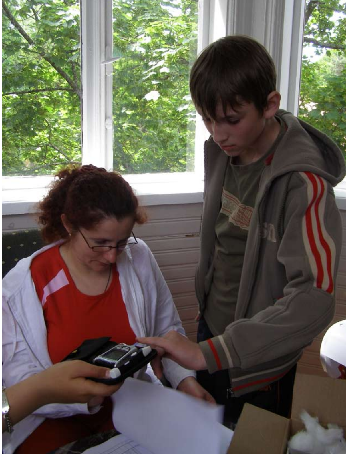
Tokia kasdienybė Such is everyday life